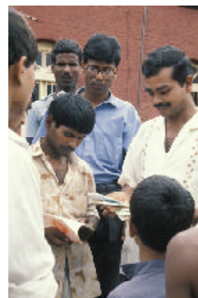
une distribution de sélections bibliques au Bangladesh

P.S.: Pour que la Parole de Dieu atteigne plus de vies encore, n'hésitez pas à parler à vos amis de notre Club une Bible par Mois.