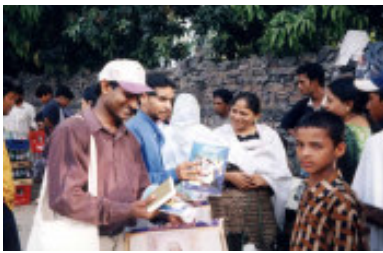
Distribution par des bénévoles