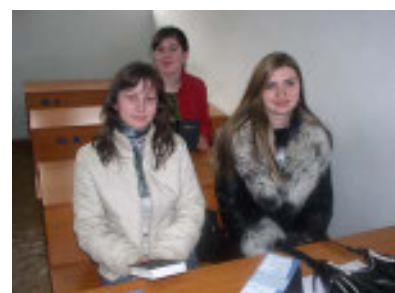
De jeunes étudiantes

La Moldavie est l'ancienne République Soviétique Socialiste de Moldavie devenue indépendante le 27 août 1991. Située entre la Roumanie et l'Ukraine, c'est un petit pays de moins de 5 millions d'habitants, à majorité orthodoxe et dont le quart de la population n'appartient à aucune religion. La langue officielle est le moldave, identique au roumain dans sa forme écrite mais très différente dans sa forme orale.