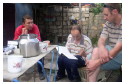
Dans un centre de réhabilitation