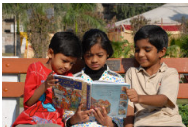
Des enfants découvrent la Bible illustrée

L'activité de la Société Biblique Pakistanaise (SBP) consiste à produire et à distribuer gratuitement ou à prix réduits des Bibles, Nouveaux Testaments, portions de la Bible et autres publications (Affiches, Traités, Calendriers, Livres de coloriage ...). Pour cela, elle collabore parfois avec d'autres organisations locales pour atteindre toute l'étendue du pays et pour toucher toutes les catégories de personnes. La SBP bénéficie également du travail des bénévoles qui s'occupent principalement de la distribution.