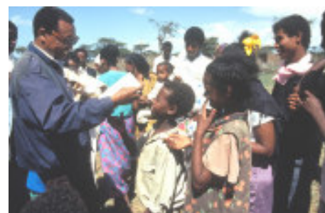
Une distribution biblique parmi les enfants d'un village d'Ethiopie

P.S.: Pour que la Parole de Dieu atteigne plus de vies encore, n'hésitez pas à parler à vos amis de notre Club une Bible par Mois.