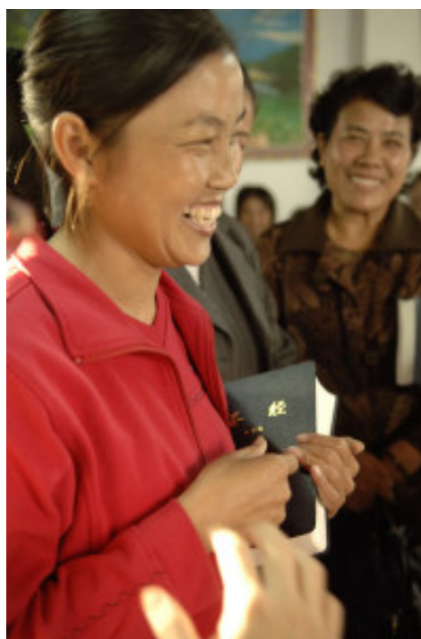
Cette dame a reçu une bible pendant une distribution gratuite à Meijia