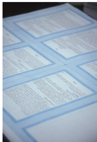
Préparation du NT en Pashtu

- Le Festival Catholique qui prend la forme d'une célébration à laquelle beaucoup de personnes viennent à pied ou en vélo malgré la distance. Il est évident que toutes ne viennent pas avec une même motivation spirituelle. Certaines viennent davantage pour la fête et le plaisir d'y rencontrer d'autres gens que pour la personne de Jésus-Christ. Beaucoup ignorent à quel point Jésus pourrait faire partie de leur vie. Ils n'ont aucune Bible, ni de Nouveau Testament chez eux.