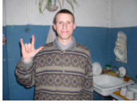
langage des signes