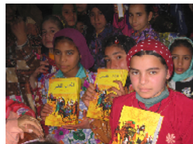
Distribution biblique en Egypte

P.S.: Notre Club aimerait accueillir des nouveaux membres. Parlez-en donc à vos amis et mettez-les en contact avec nous. Merci!