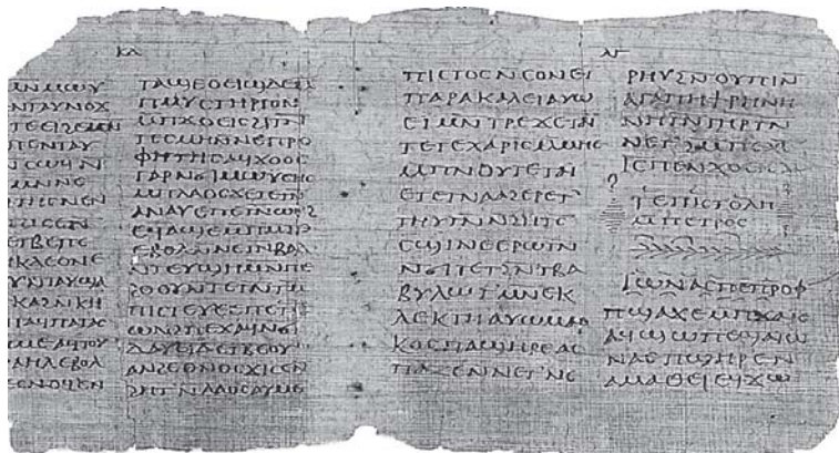
Le codex Crosby-Schøyen (3 e siècle) : le plus vieux manuscrit de Jonas et 1 Pierre. © The Schøyen Collection, MS 193

Le catholicisme, par opposition à la Réforme, a arrêté sa liste définitive des livres de la Bible à l'occasion du concile de Trente, en 1546, en y intégrant les deutérocanoniques.