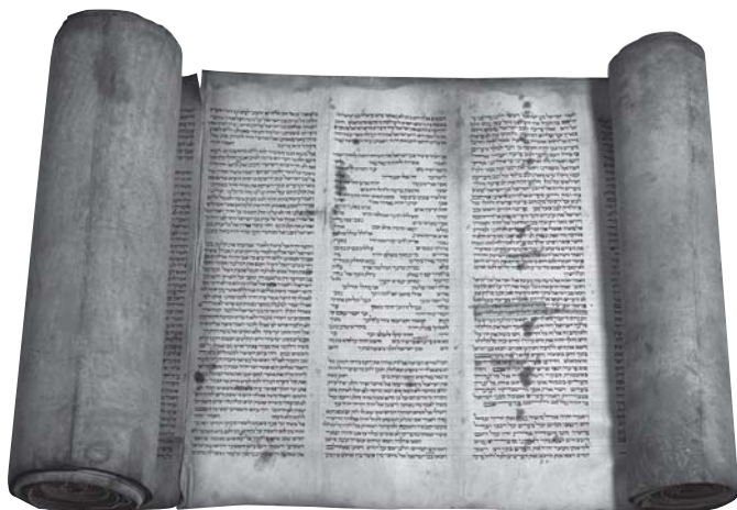
Rouleau de la Torah (BNF – Manuscrits, hébreu 58, Cantique de la mer Rouge, Exode 15.1-18, 17 e et 18 e siècle)

La tradition orthodoxe, pour laquelle le grec est la langue de référence, conserve globalement tous les livres écrits dans cette langue. Le canon orthodoxe de l'Ancien Testament correspond donc à celui de la Septante.